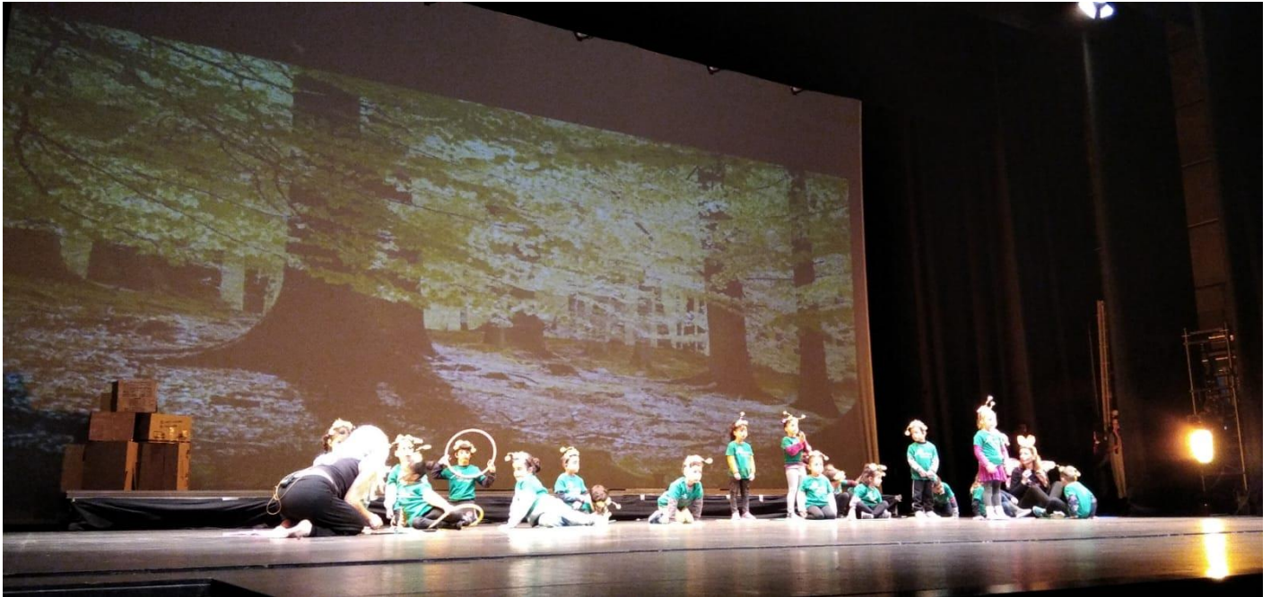
Actividad MUS-e en el teatro Kursaal con alumnos de Educación Infantil.