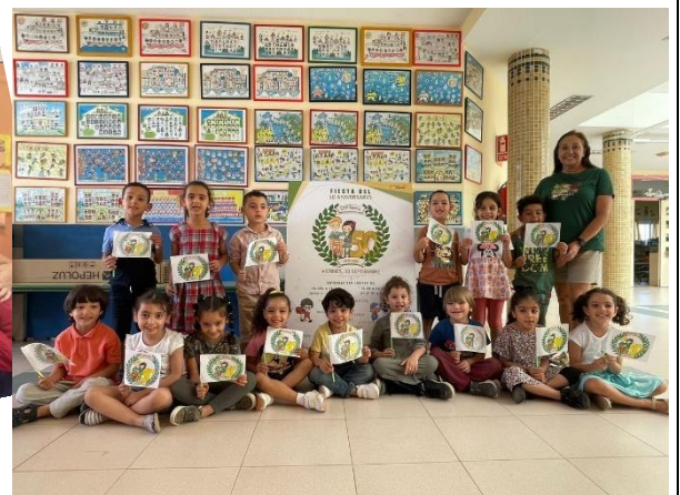
Alumnos y seño de Infantil 5 años C.