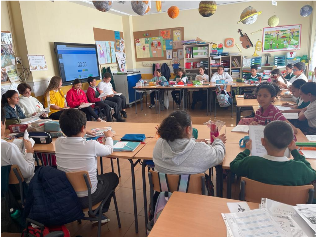
Tertulia dialógica con obras literarias clásicas en el aula de 6ºB.