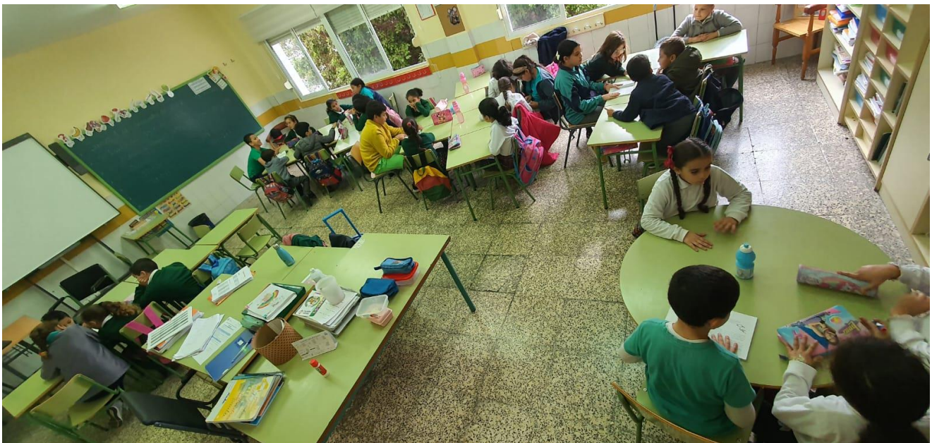
Alumnos de 5ºA haciendo de “tutores lectores” con los compañeros de 2ºC.

En 5ºA practicamos las tertulias dialógicas literarias con Romeo y Julieta, pero también hemos hecho curriculares con el libro de conocimiento del medio de 5º. También hemos dialogado con películas como Oliver Twist y esperamos aprender muchas más. Son muy importantes porque muchas cosas que vemos en la tele ahora son copias de lo que ya se escribía mucho antes.