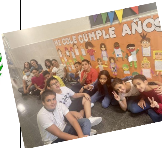
Decoración en los pasillos por el 50 aniversario de nuestro colegio.